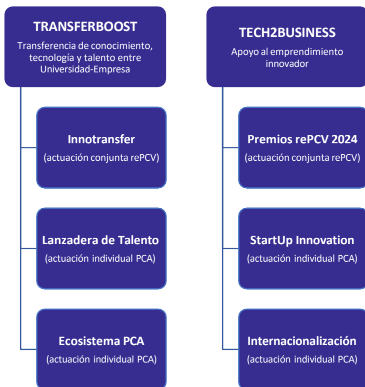
Ilustración 3 Propuesta de proyectos en el marco del convenio

En el siguiente esquema se puede ver gráficamente la distribución de los proyectos entre las dos líneas y tipos de actividad: