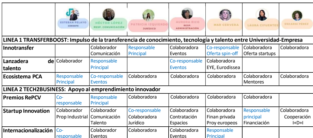
Tabla 1.- Responsabilidades de la plantilla del PCA en la ejecución del convenio