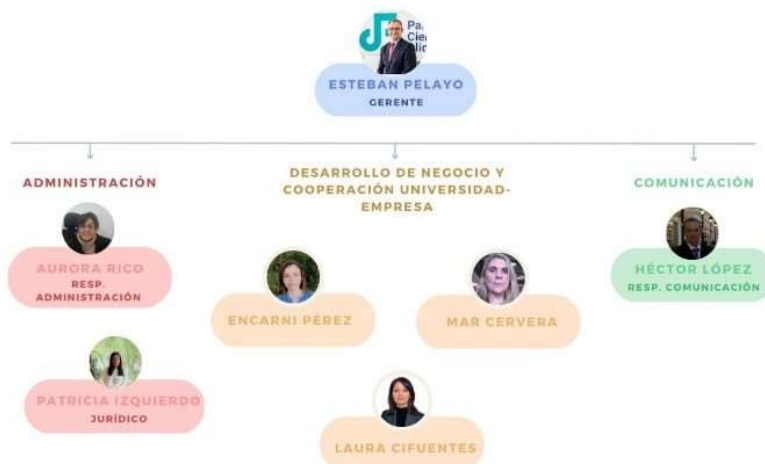
Ilustración 2: Organigrama del Parque Científico de Alicante