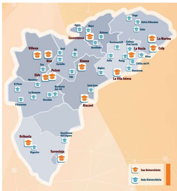
Ilustración 4: mapa de sedes y aulas de la Universidad de Alicante

Se prestará especial atención a la extensión territorial, no limitándose al ámbito universitario. La Universidad de Alicante, con sus 13 sedes y 29 aulas, ejecuta programas culturales en estrecha colaboración con los ayuntamientos locales. La unidad encargada de coordinar estas sedes buscará expandir su oferta de actividades, enfocándose en contenido innovador y científico. La formación de inversores y el respaldo al emprendimiento deeptech, se extenderán a través de las sedes y las agencias de desarrollo local colaboradoras. Se pretende extender las ventajas del Parque Científico a todo