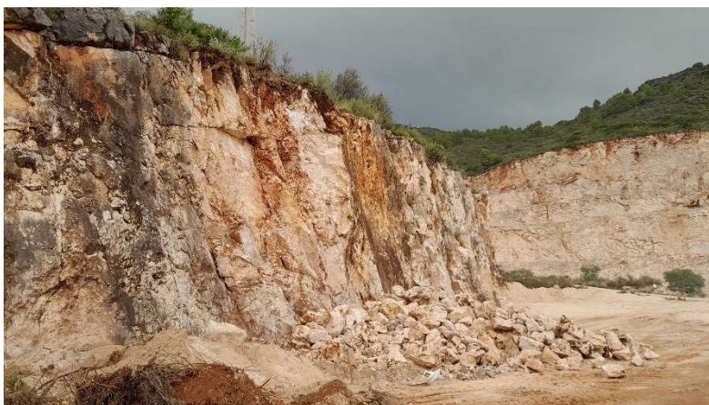
Ilustración 1: Pared saneada, antes y después