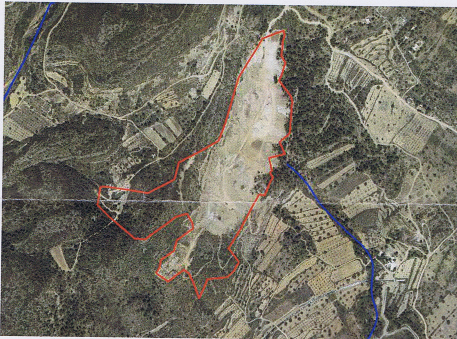
Figura 1. Ámbito de la actuación con indicación de los cauces existentes en el entorno

Sin perjuicio de lo dispuesto en los artículos 2, 4 y 5 del texto refundido de la Ley de Aguas, según la serie a escala 1:25000 del Mapa Topográfico Nacional, en el entorno de la actuación se ubican los cauces que se indican en la figura siguiente: