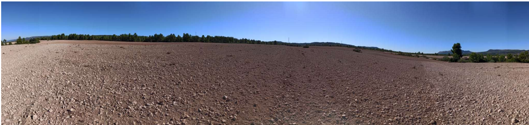
PUNTO 3: PLANTA SOLAR FOTOVOLTAICA. VISTA SUR