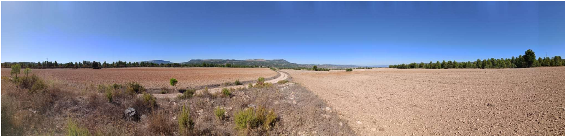
PUNTO 2: PLANTA SOLAR FOTOVOLTAICA. VISTA NORTE