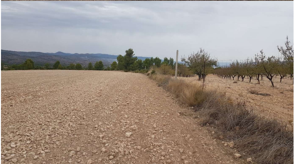
PUNTO 6: PLANTA SOLAR. VISTA 360°, EN DIRECCIÓN CONTRARIA AGUJAS DEL RELOJ