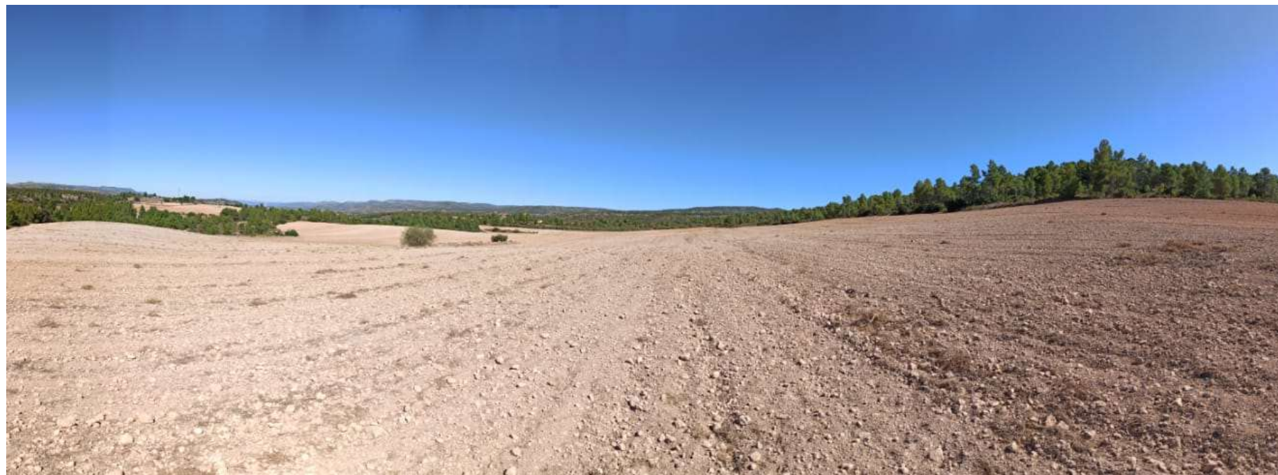
PUNTO 9: PANORAMICA PLANTA SOLAR