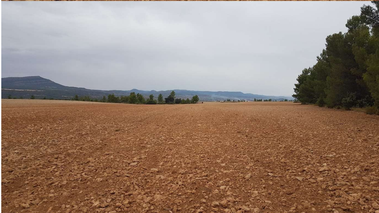
PUNTO 4: PLANTA SOLAR FOTOVOLTAICA. VISTA DE OESTE A ESTE