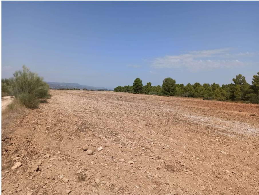
PUNTO 1: VISTA DE SUBESTACIÓN