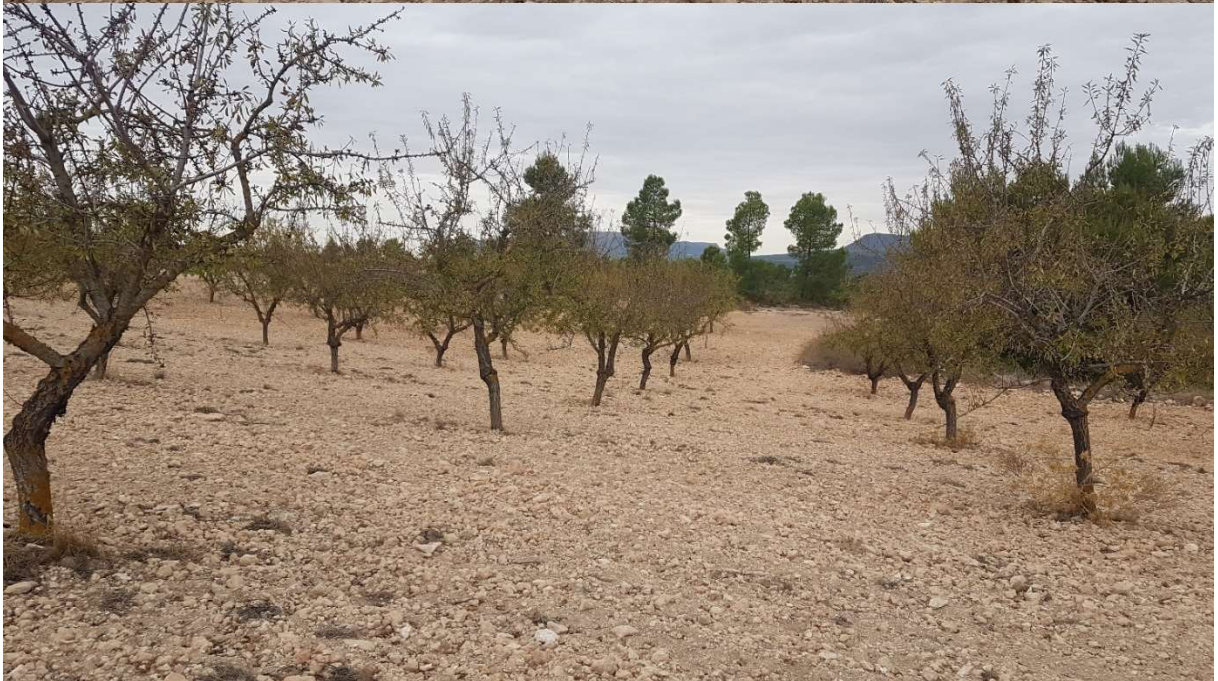
PUNTO 7: VISTA PLANTA SOLAR 180°. DIRECCIÓN SUR