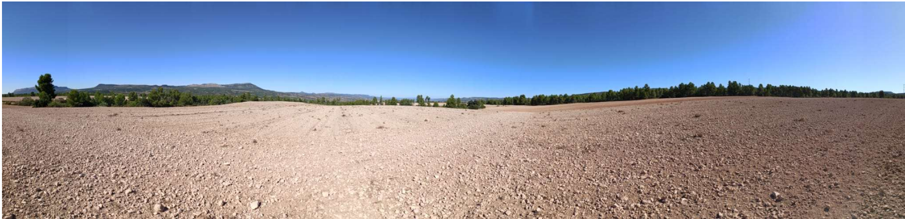
PUNTO 3: PLANTA SOLAR FOTOVOLTAICA. VISTA NORTE