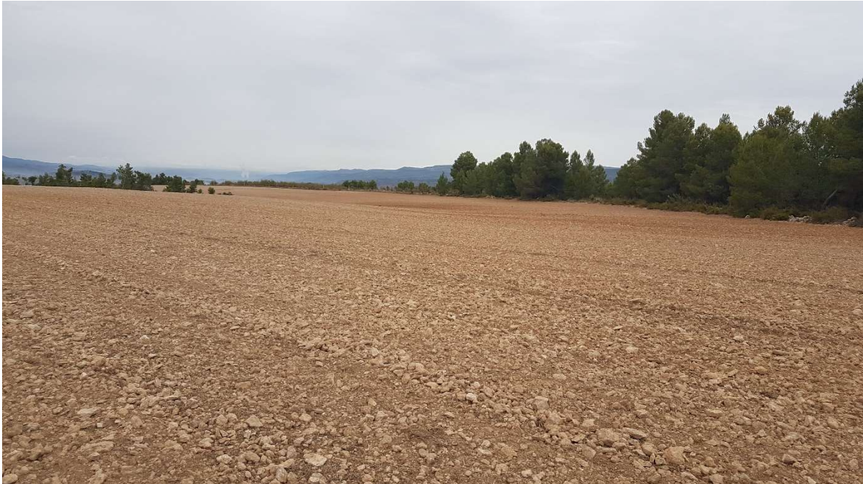
PUNTO 5: PLANTA SOLAR. VISTA 360 °, EN DIRECCIÓN CONTRARIA AGUJAS DEL RELOJ