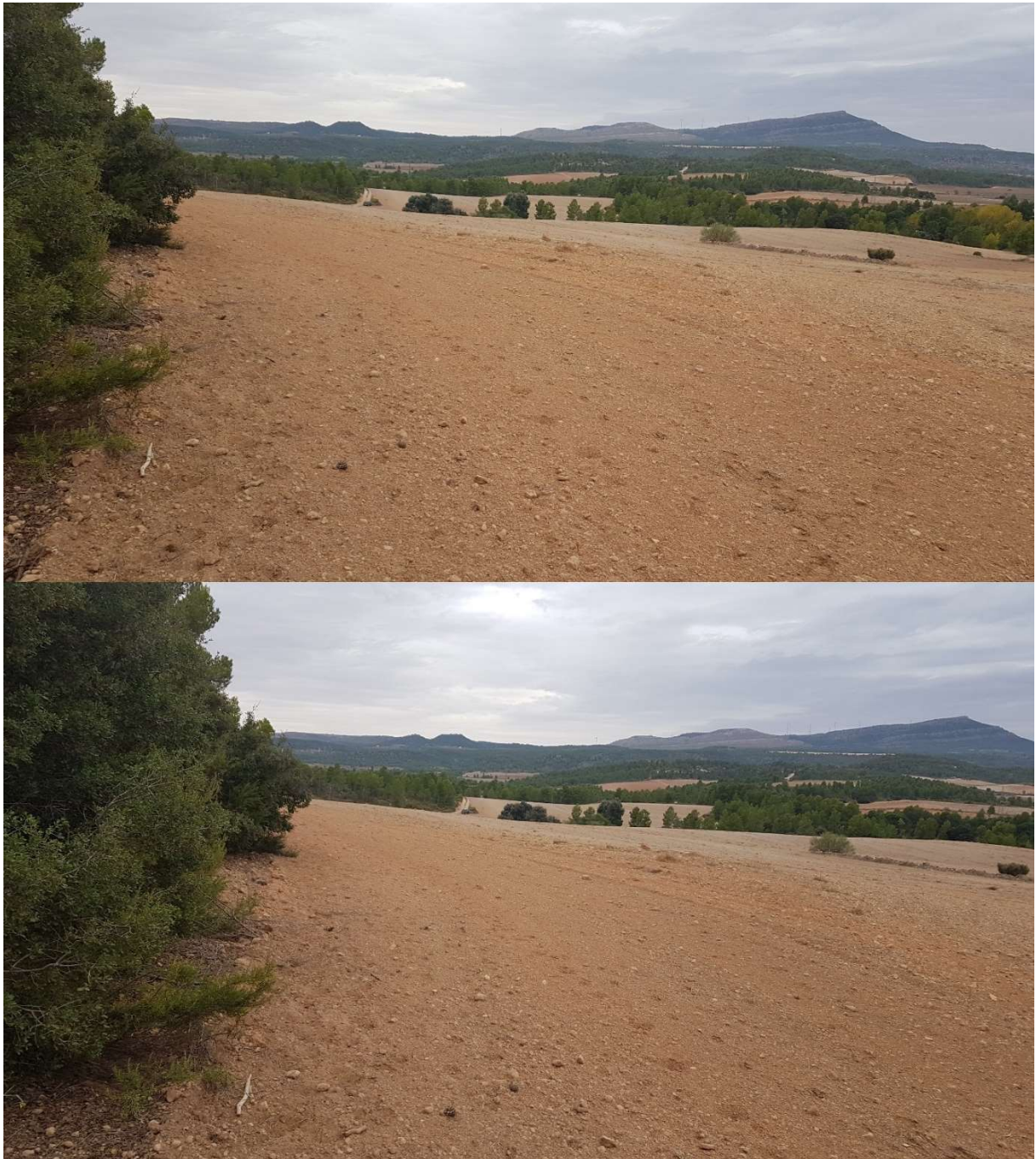
PUNTO 8: VISTA PLANTA SOLAR DIRECCIÓN NORTE. 180°