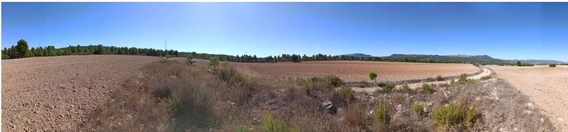
PUNTO 2: PLANTA SOLAR FOTOVOLTAICA. VISTA SUR