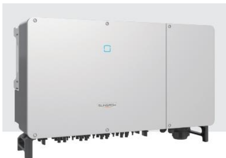
Ilustración 3. Inversor de potencia.

Este inversor dispone de 24 entradas con monitorización inteligente para los strings, y 12 seguidores del punto de máxima potencia que le dotan de versatilidad para diferentes diseños de instalación.